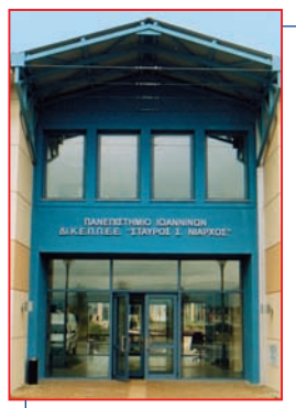
ΔΙΕΘΝΕΣ ΚΕΝΤΡΟ ΕΛΛΗΝΙΚΗΣ ΠΑΙΔΕΙΑΣ - ΠΑΡΑΔΟΣΗΣ ΚΑΙ ΕΠΑΓΓΕΛΜΑΤΙΚΗΣ ΕΚΠΑΙΔΕΥΣΗΣ (ΔΙ.Κ.Ε.Π.Π.Ε.Ε. "Σταύρος Σ. Νιάρχος")